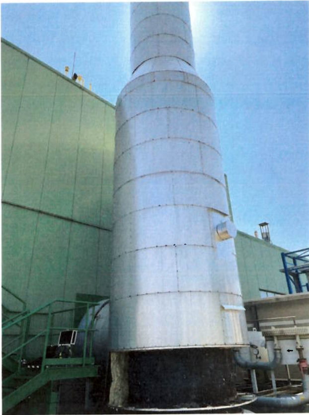
Obrázok č. 1: TK8 – vyústenie spalín